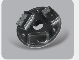
Standart / Standard