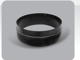
Standart / Standard