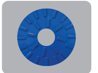
Opsiyonel / Optional

Parke makinelerimiz ev, büro, gibi her türlü yapıların parke ve ahşap yüzeylerinin zımparalanmasında kullanılmaktadır. Fanın yüksek emiş gücü sayesinde zeminde toz bırakması minimum seviyeye indirilmiştir. Sınıftaki bir çok üründen farklı olarak, bezli zımpara takılabilen bir diske sahip olması ve hassas ayar kolları sayesinde makinenin zımpara diskinin seri bir şekilde ayarlanmasında ve zemimin üzerindeki çizilmelerin önlenmesini sağlayarak maksimum verim sağlar. Parke makinelerimiz kolay ve etkin kullanımı, taşınabilirliği sayesinde geniş bir kullanıcı çevresi tarafından kullanılmaktadır.